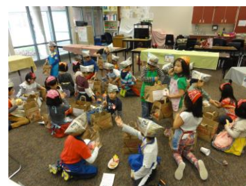
上手にできたお店屋さん