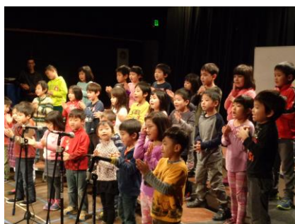
まぼろしの学芸会練習