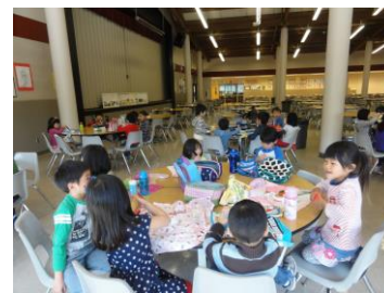
いつもおいしいお弁当