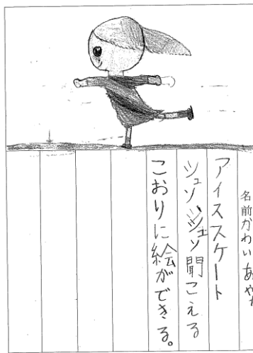
2年2組 河合 彩花