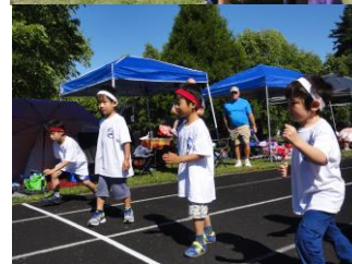
はじめての運動会